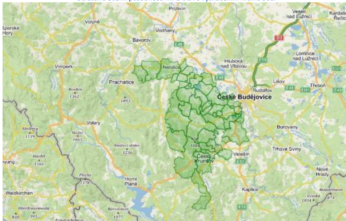
Obrázek 1 Území působnosti MAS BLN s vyznačením hranic obcí