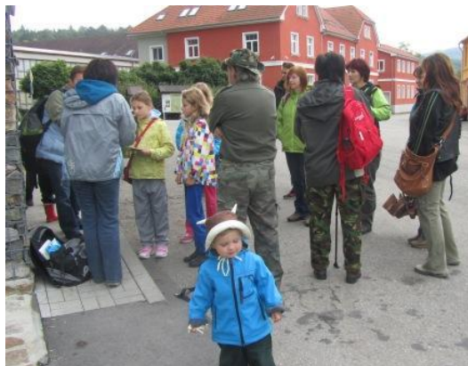
Sraz na autobusové zastávce v Brloze

V sobotu 21. 9. 2013 se konal jeden z hvězdicovitých výletů v rámci projektu „S Peklíkem na vandr ve spolupráci MAS Blanský les – Netolicko a MAS Rozkvět zahrady jižních Čech. Výlet na Kuklov začínal v Brloze – sraz byl v 9 hod u autobusové zastávky. I přes nepřízeň počasí před tímto výletem se na nás „sluníčko přece jen usmálo“ – nepršelo (jen občas spadlo pár kapiček), takže se sešlo docela hodně účastníků. Z Brloha se jedna skupina turistů vydala k druhému stanovišti, kde už čekala velká část rodičů s dětmi, aby se společně vydali na „Peklíkovu stezku“. Tam si děti vyzkoušely různé úkoly a disciplíny např. poznávání hub, protáhnout se pavučinou, uhodnout maskota Peklíka, přejít po kamenech, najít obrázky, poskládat puzzle, lezení po laně apod. V cíli - na Kuklově - bylo každé děčko odměněno medailí a sladkostí. Také každý zúčastněný obdržel dárek – Pexeso a pamětní suvenýr s logem Peklíka. Poté si každý mohl prohlédnout místní klášter, zříceninu hradu a malou farmu se zvířaty. Doufáme, že se všem výlet líbil.