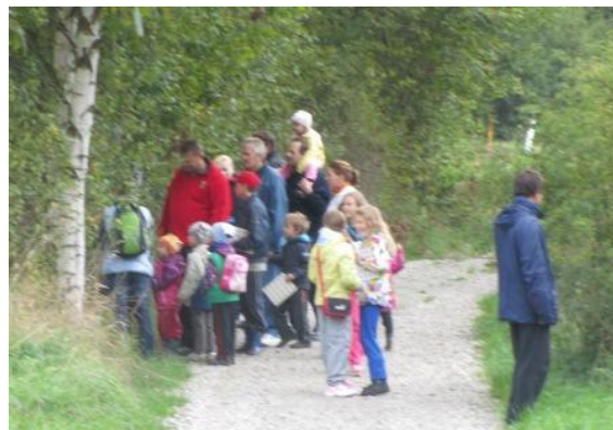
Při plnění úkolů

Akce je realizována v rámci projektu Spolupráce: „S PEKLÍKEM NA VANDR“ reg. č. 12/015/4210a/231/000019.