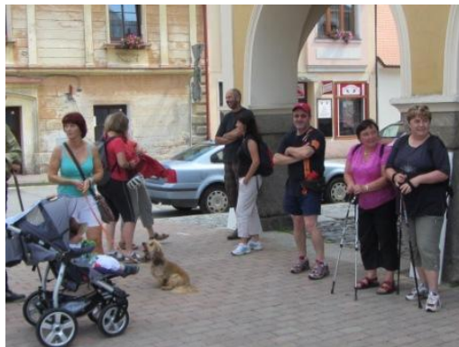
Sraz na pěší výlet před muzeem