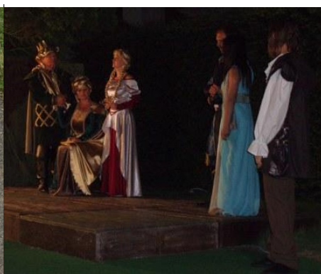
Večerní představení Ondina na Kratochvíli

Akce je realizována v rámci projektu Spolupráce: „S PEKLÍKEM NA VANDR“ reg. č. 12/015/4210a/231/000019.